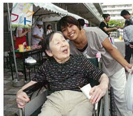
私達は法人の理念である『共生』を心肝に日々活動しています。