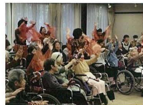
ボランティアさんに鳴子踊りを披露頂きました。