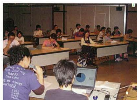
『身体拘束廃止宣言』に基づく施設内研修会の模様です