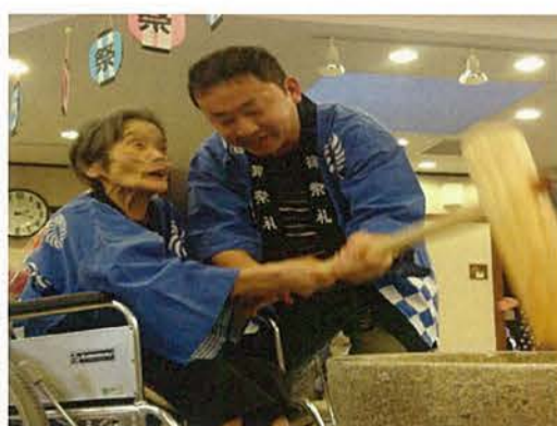
毎回入居者様から逆に『元気』を頂く餅つき大会