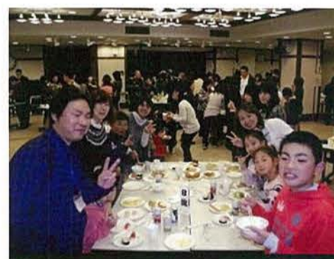
毎日職員を支えて頂いていますご家族を招待してパーティーを開催しました。