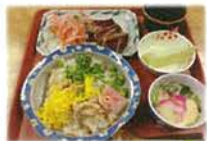
①子供の日 ちらし寿司と壁のタタキ オヤツは柏餅