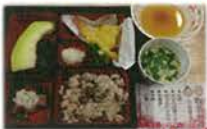
②敬老の日 天ぷらにマグロ 季節の果物・巨峰を添えて

その季節感を演出するために、写真③～⑤は、通常とは異なるメニューを取り入れています。写真⑥は、沖縄料理のタコライスです。写真⑦は、オムライスです。写真⑧は、イクラのちらし寿司です。写真⑨は、夏バテ防止の食べ物です。写真⑩は、ねりきりまんじゅうです。