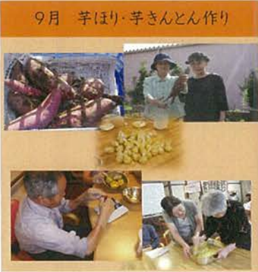
9月 芋ほり・芋きんとん作り