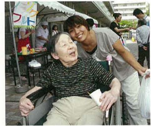
私達は法人の理念である『共生』を心肝に日々活動しています。