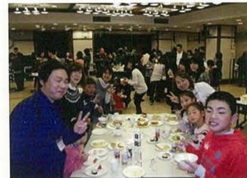
毎日職員を支えて頂いていますご家族を招待してパーティーを開催しました。