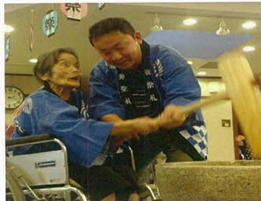
毎回入居者様から逆に『元気』を頂く餅つき大会