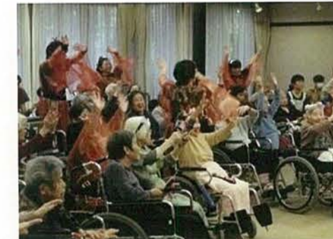
ボランティアさんに鳴子踊りを披露頂きました。