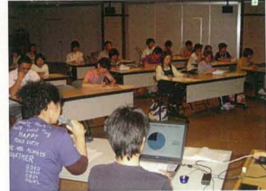
『身体拘束廃止宣言』に基く施設内研修会の模様です