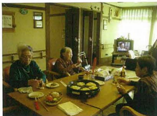
ユニットでお好み焼きパーティーをしました！

設立 1997年7月11日 代表者氏名 理事長 若月 剛一 事業内容 特別養護老人ホーム・ショートステイ・デイサービス・ケアハウス・ヘルパーステーション他 従業員数 280人 法人所在地 愛知県春日井市神屋町1310 ホームページ http://www.asahigaoka-fukushi.or.jp/