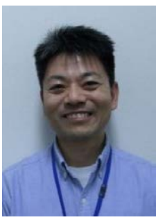
社会福祉法人春生会 特別養護老人ホーム ショートステイ 養護老人ホーム しょうなあさひが丘

平成29年4月1日より、「しょうなあさひが丘」施設長を拝命いたしました。施設長として携うことの責任の重みを痛感しております。法人理念である「共生」を念頭に、地域の高齢者福祉に微力ながら貢献できるよう取り組んでまいります。施設運営に当たりましては、職員間のチームワークを大切に、利用者のご家族・ボランティアの方々・地域の皆様や関係各位との連携を密にしながら精一杯支援を实践させていただく所存です。 今後も、しょうなあさひが丘の皆様方に愛され、更なる信頼をいただける施設を目指して、職員一同一層の研鑽と努力を重ねてまいりますので、ご指導の程、宜しくお願い申し上げます。