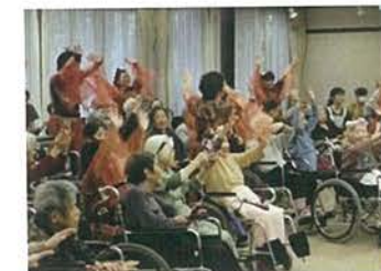
ボランティアさんに鳴子踊りを披露頂きました。