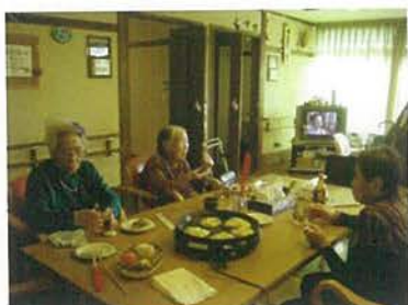
ユニットでお好み焼きパーティーをしました！

設立 1997年7月11日 代表者氏名 理事長 若月 剛一 事業内容 特別養護老人ホーム・ショートステイ・デイサービス・ケアハウス・ヘルパーステーション他 従業員数 280人 法人所在地 愛知県春日井市神屋町1310 ホームページ http://www.asahigaoka-fukushi.or.jp/