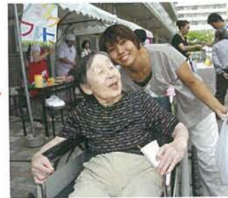
私達は法人の理念である『共生』を心肝に日々活動しています。