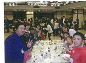
毎日職員を支えて頂いていますご家族を招待してパーティーを開催しました。