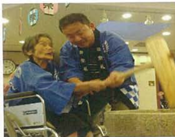
毎回入居者様から逆に『元氣』を頂く餅つき大会