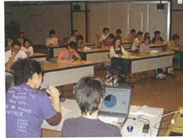
『身体拘束廃止宣言』に基づく施設内研修会の模様です