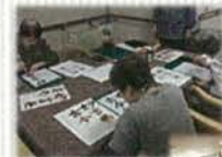
各種教室(ボランティアさん)