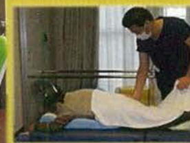
機能訓練指導員による機能訓練