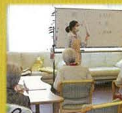
体操やレクリエーション