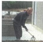
H23・5/5 出来あがった畑を耕して下さいました。