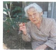
H23・6月 キュウリとトマトを収穫