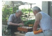
午前中は日陰なので将棋を楽しみました。