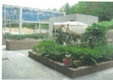
現在のあさひみのり園