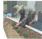
皆さんに手伝って頂いて植え付け作業をしました。大きな〜れと願いを込めて。