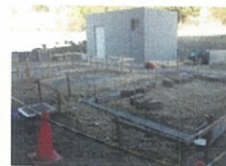
H23・4月 工事中のあさひみのり園

5月より本格始動しましたあさひみのり園です。皆さんのご協力のおかげで立派な畑が完成しました。経験のある方が率先して教えて下さり7月現在では収穫をしたり、成長中の野菜を見て楽しんだりして下さる方が増えてきました。