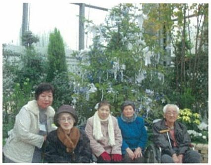
都市緑化植物園の温室内。クリスマスバージョンの木の前で記念撮影

今年十一月の中旬から下旬にかけて瀬戸市にある定光寺と春日井市都市緑化植物園へ紅葉散策に出掛けました。定光寺の紅葉はまだ見ごろではなかったのですが、山の台から見た景色は素晴らしいものでした。