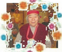
本日のスマイル賞(^-^)