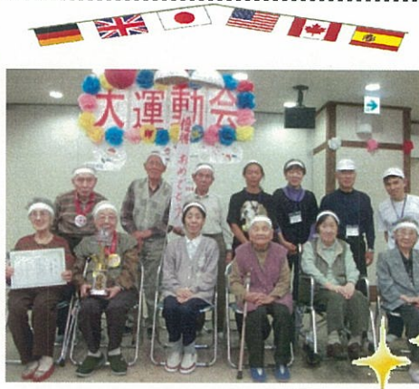
閉会式後みんなで記念撮影

十月二四日から二六日までデイサービス運動会が開催されました。玉入れやパン食い競争、物送りゲーム、職員競技など満載でした。