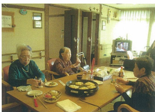
ユニットでお好み焼きパーティーをしました。