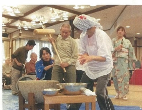
入居者様から逆に『元気』を頂いた餅つき大会