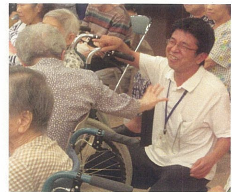
私達は法人の理念である『共生』を心肝に日々活動しています。