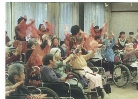
ボランティアさんに鳴子踊りを披露頂きました。