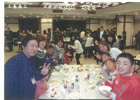
毎日職員を支えて頂いていますご家族を招待してパーティーを開催しました。