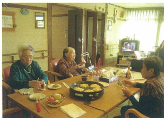
ユニットでお好み焼きパーティーをしました。