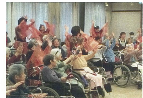
ボランティアさんに鳴子踊りを披露頂きました。