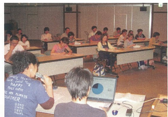
『身体拘束廃止宣言』に基く施設内研修会の模様です。