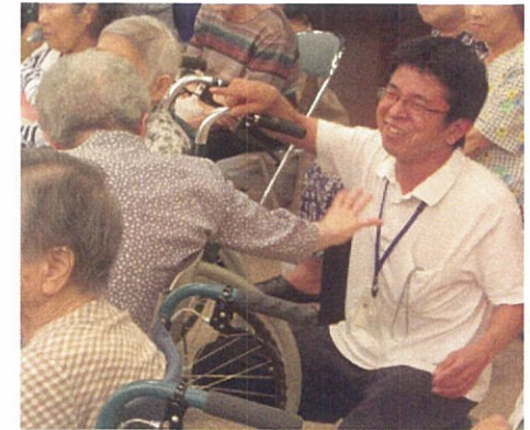
私達は法人の理念である『共生』を心肝に日々活動しています。