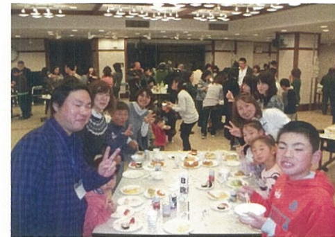
毎日職員を支えて頂いていますご家族を招待してパーティーを開催しました。