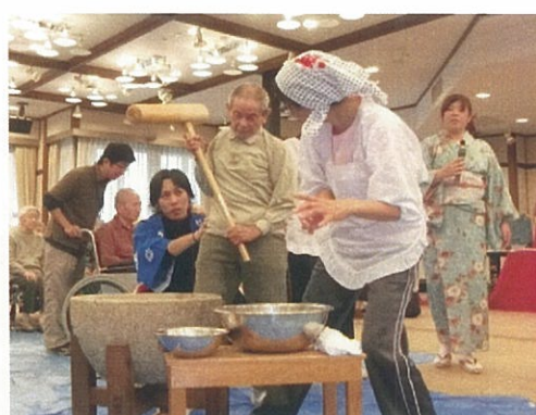
入居者様から逆に『元氣』を頂いた餅つき大会