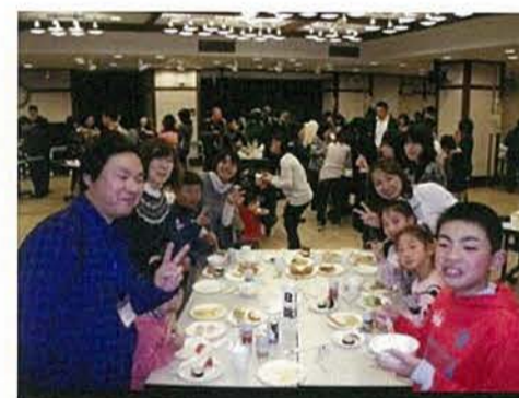
毎日職員を支えて頂いていますご家族を招待してパーティーを開催しました。