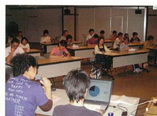
『身体拘束廃止宣言』に基く施設内研修会の模様です。