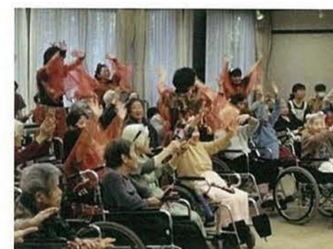
ボランティアさんに鳴子踊りを披露頂きました。