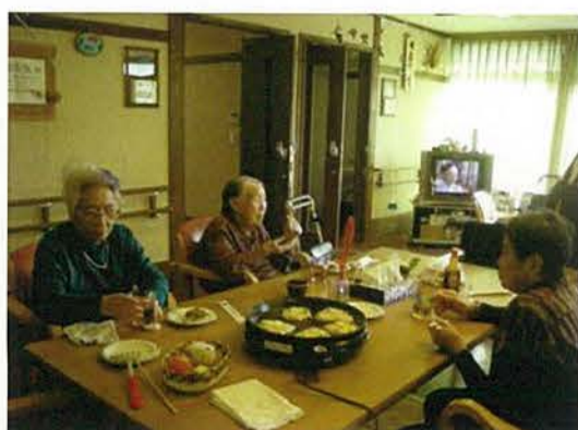
ユニットでお好み焼きパーティーをしました。