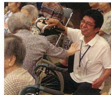
私達は法人の理念である『共生』を心肝に日々活動しています。