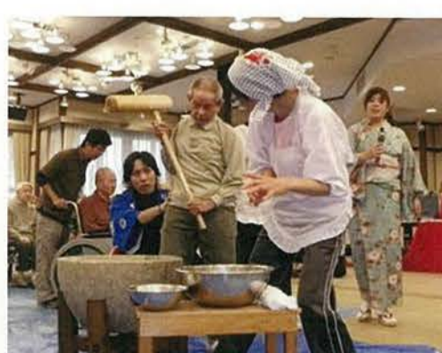
入居者様から逆に『元気』を頂いた餅つき大会