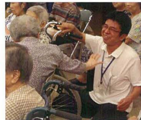
私達は法人の理念である『共生』を心肝に日々活動しています。