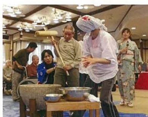
入居者様から逆に『元気』を頂いた餅つき大会