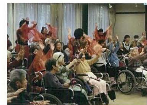
ボランティアさんに鳴子踊りを披露頂きました。