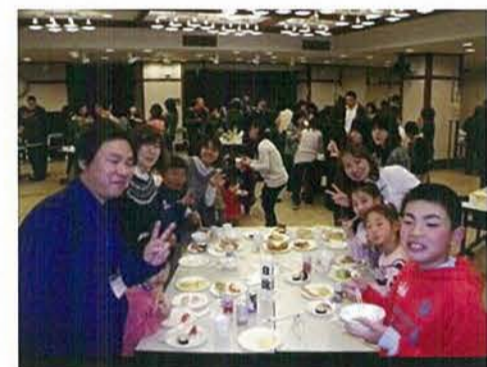
毎日職員を支えて頂いていますご家族を招待してパーティーを開催しました。