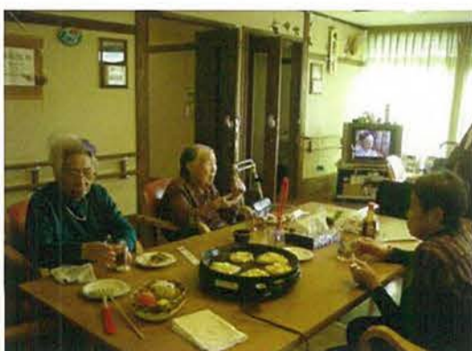
ユニットでお好み焼きパーティーをしました。