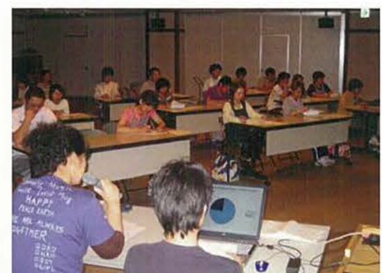
『身体拘束廃止宣言』に基づく施設内研修会の模様です。