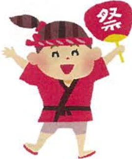
社会福祉法人 春生会 あさひが丘機能訓練指導員