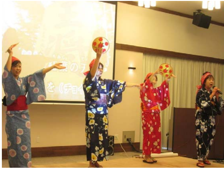
← 大盛り上がりの花笠音頭

しょうなショートステイ5周年記念祭を6月6日に1階の多目的スペースで行いました。