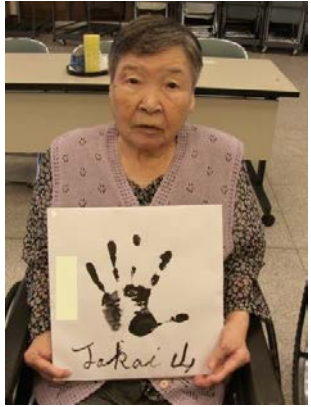
← 大関からのサインに困惑(笑)