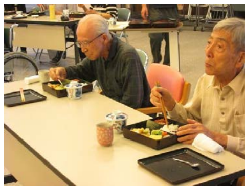
→出し物を楽しんだ後は、特製弁当&茶碗蒸し★