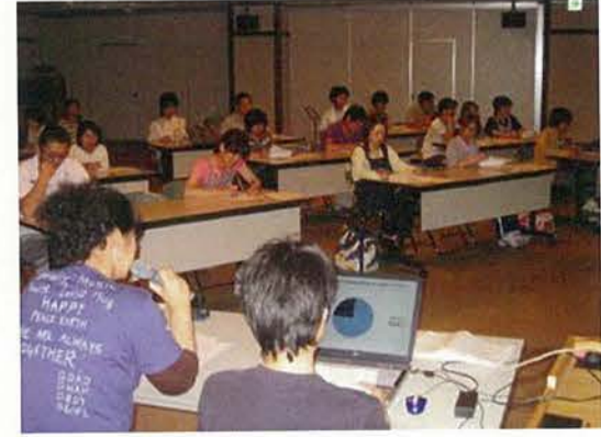
『身体拘束廃止宣言』に基く施設内研修会の模様です