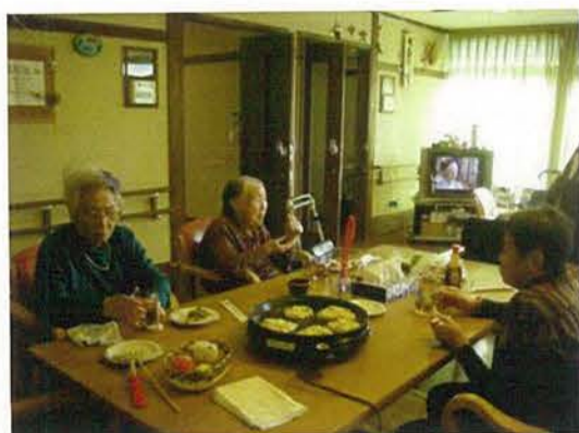
ユニットでお好み焼きパーティーをしました！

設立 1997年7月11日 代表者氏名 理事長 若月 剛一 事業内容 特別養護老人ホーム・ショートステイ・デイサービス・ケアハウス・ヘルパーステーション他 従業員数 280人 法人所在地 愛知県春日井市神屋町1310 ホームページ http://www.asahigaoka-fukushi.or.jp/