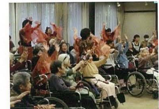
ボランティアさんに鳴子踊りを披露頂きました。