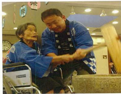
毎回入居者様から逆に『元氣』を頂く餅つき大会