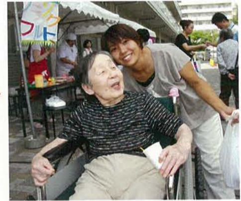
私達は法人の理念である『共生』を心肝に日々活動しています。