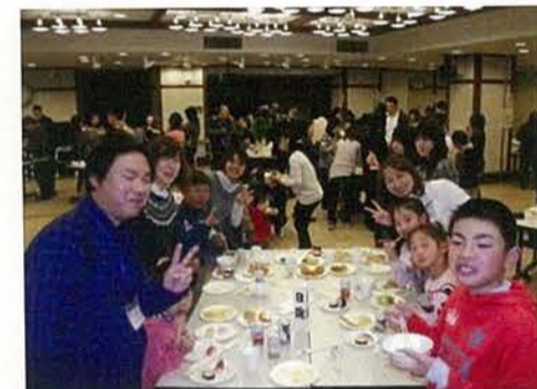
毎日職員を支えて頂いていますご家族を招待してパーティーを開催しました。