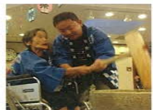
毎回入居者様から逆に『元気』を頂くつぎ大会

経営理念・運営方針 私どもは若い施設らしく固定観念にとらわれることなく、ノーマライゼーションの考えに立って、法人理念である『共生』を心肝に染め、利用される方々の自然な生活空間を提案していきたいと考えています。例えば、入居者様に『ここで快適に暮らして欲しい』という気持ちから、そんな暮らしを見守るスタッフが白衣や制服では威圧感を与えてしまうのではと考え、入居者様を訪ね来設されるご家族同様、私服で通すことにしています。また、平成19年度より教育推進事務局を設置、職員教育にも力を入れ、当法人にて末永く活躍してもらう為の自己研鑽の場を設けています。