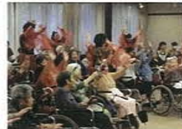
ボランティアさんに帽子編りを披露頂きました。