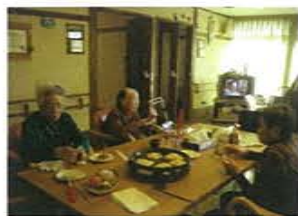
ユニットでお好み焼きパーティーをしました！