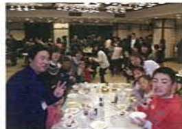
毎日職員を支えて頂いていますご家族を招待してパーティーを開催しました。