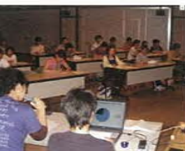
『身体拘束廃止宣言』に基づく施設内研修会の模様です。