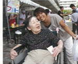
私達は法人の理念である『共生』を心肝に日々活動しています。