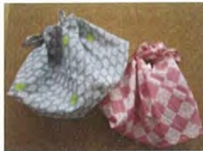
手ぬぐいのあずま袋