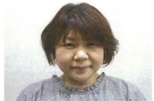
D S 支援員