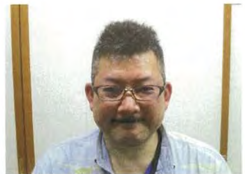
D S 運転手