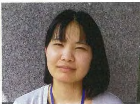
事務所管理栄養士